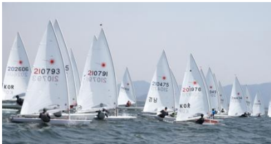
요트대회 및 체험