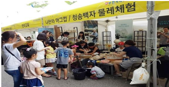
각종 체험 부스